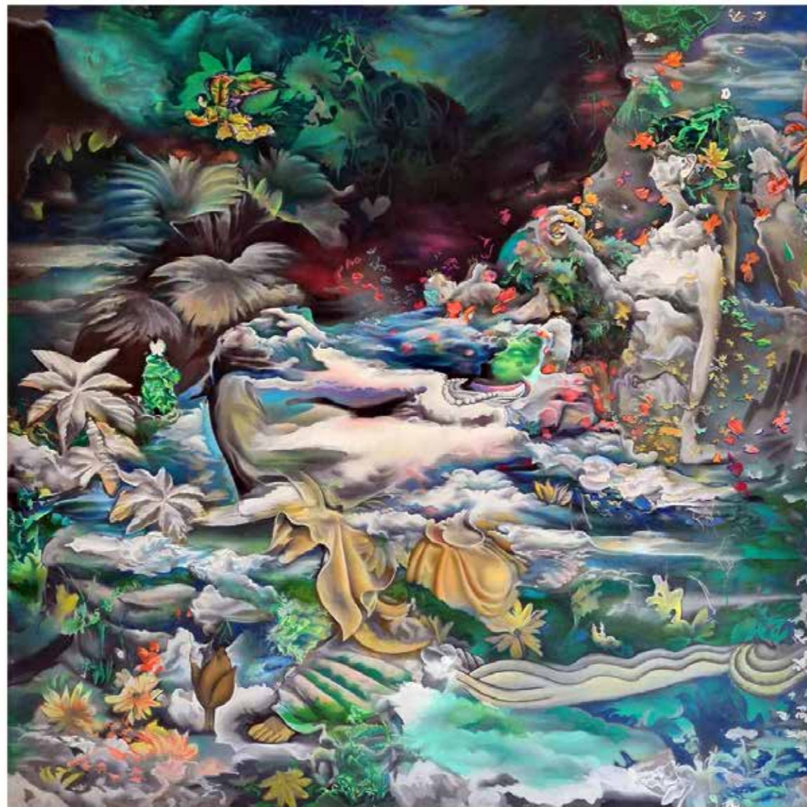
Drowsy Clouds, 2022 Oil on Canvas 100 cm x 100 cm

الغيوم النعسانة، ٢٠٢٢ زيت على قماش ١٠٠ سم × ١٠٠ سم