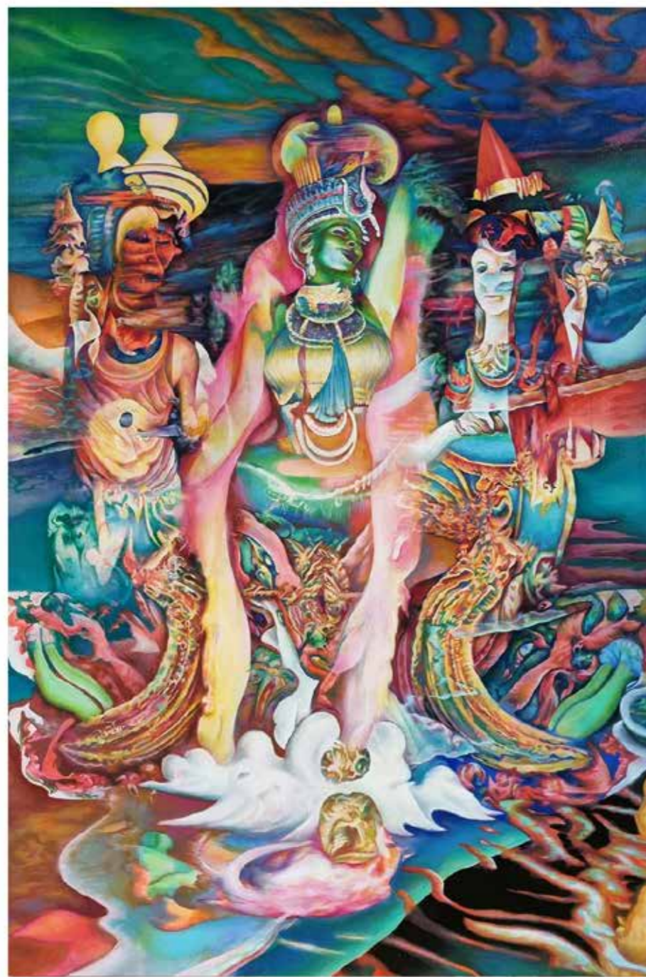
Night Sky Celebration II, 2023 Oil on canvas 80cm x120 cm

احتفال سماء الليل ٢، ٢٠٢٣ زيت على قماش ٨٠ سم × ١٢٠ سم