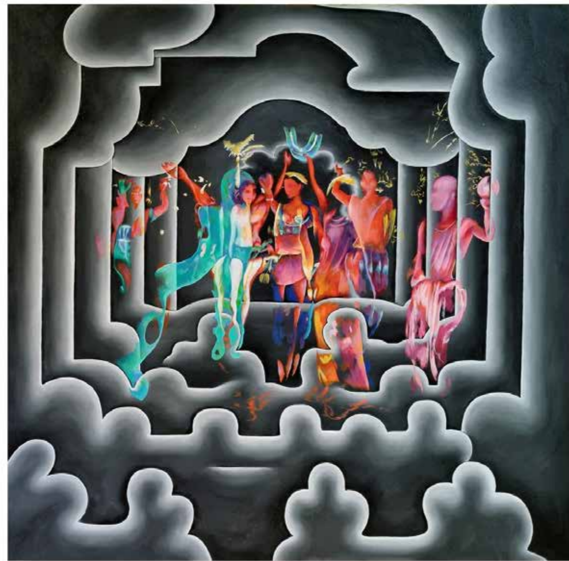
Symbol Sky, 2022 Oil on Canvas 100 cm x 100 cm

رمز السماء، ٢٠٢٢ زيت على قماش ١٠٠ سم x ١٠٠ سم