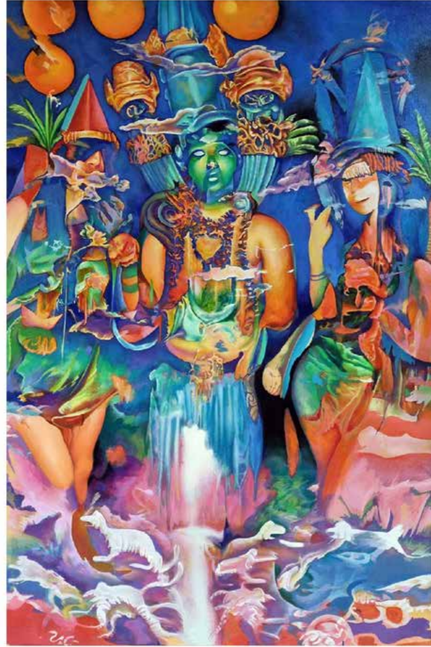
Night Sky Celebration, 2023 Oil on canvas 80cm x120 cm

احتفال سماء الليل، ٢٠٢٣ زيت على قماش ٨٠ سم × ١٢٠ سم