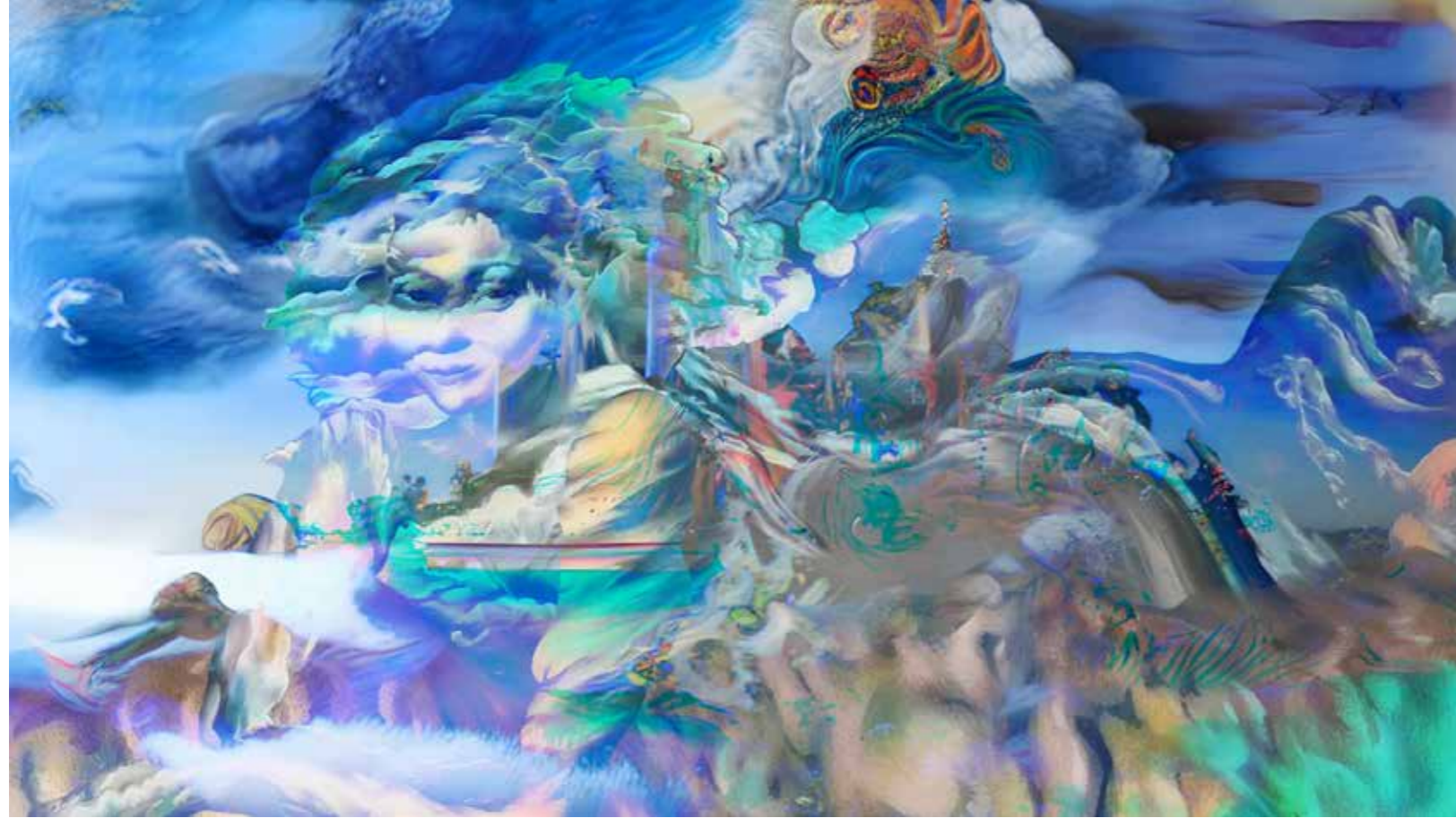
Long Distance, 2023 Video 3:00 mins