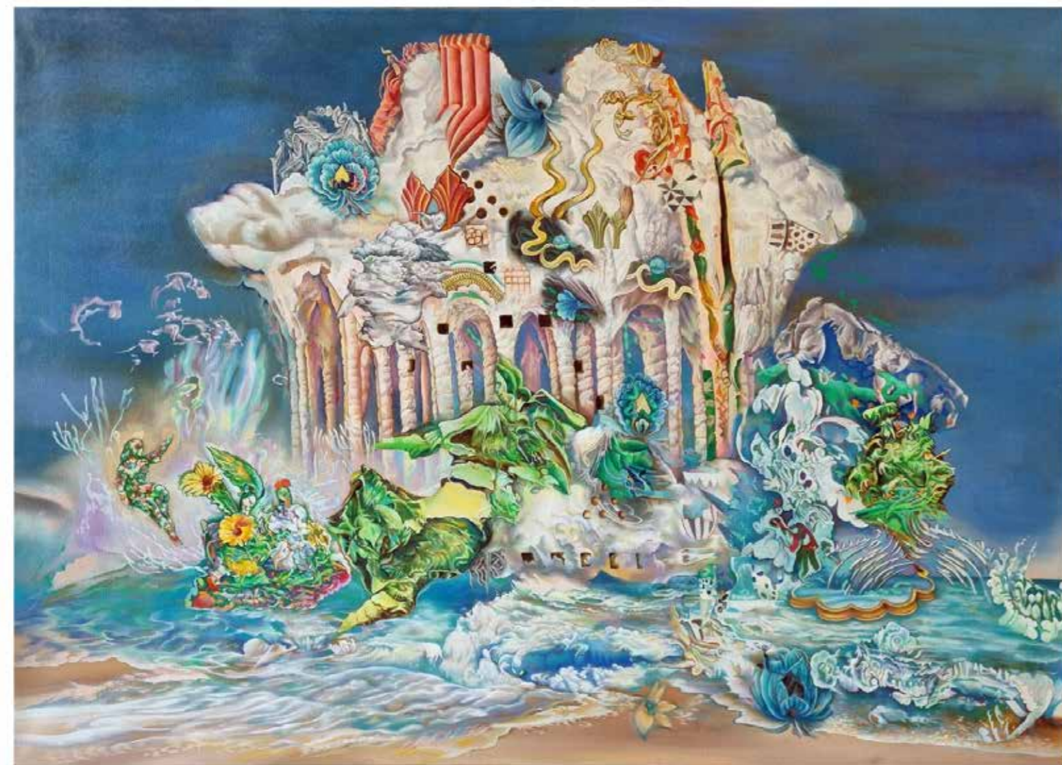
Cloud Shores, 2022 Oil on Canvas 100 cm x 140 cm

شاطئ الغيوم، ٢٠٢٢ زيت على قماش ١٠٠ سم × ١٤٠ سم