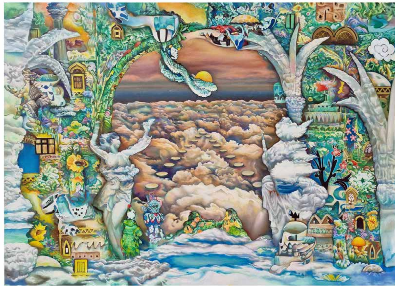
Cloud Gates, 2022 Oil on Canvas 100 cm x 140 cm

بوابات الغيوم، ٢٠٢٢ زيت على قماش ١٠٠ سم × ١٤٠ سم