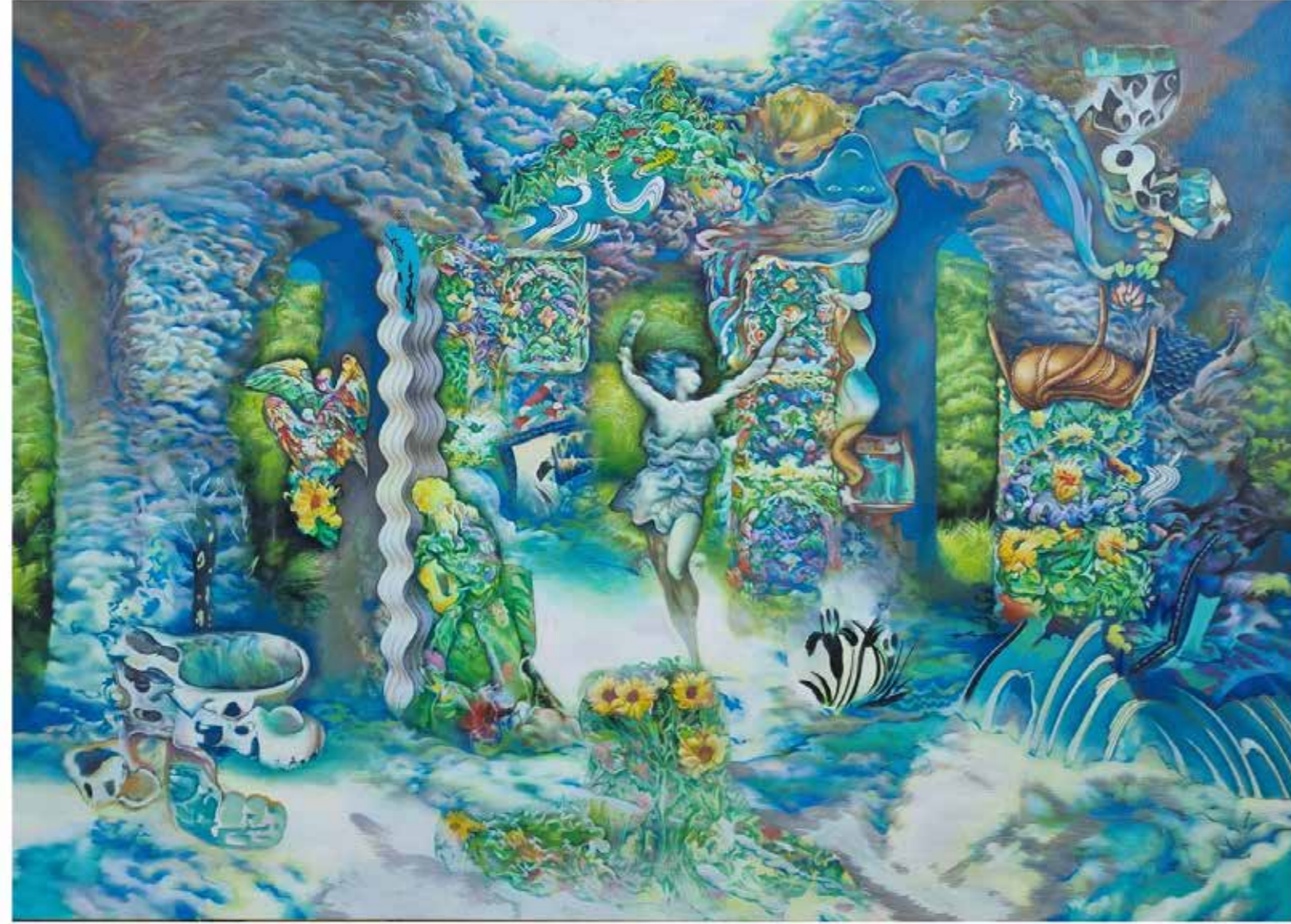
Cloud Dwelling, 2022 Oil on Canvas 100 cm x 140 cm

مسكن الغيوم، ٢٠٢٢ زيت على قماش ١٠٠ سم × ١٤٠ سم