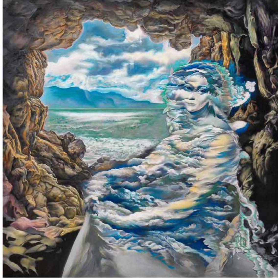
Dear Clouds, 2022 Oil on Canvas 100 cm x 100 cm

الغيوم العزيزة، ٢٠٢٢ زيت على قماش ١٠٠ سم × ١٠٠ سم